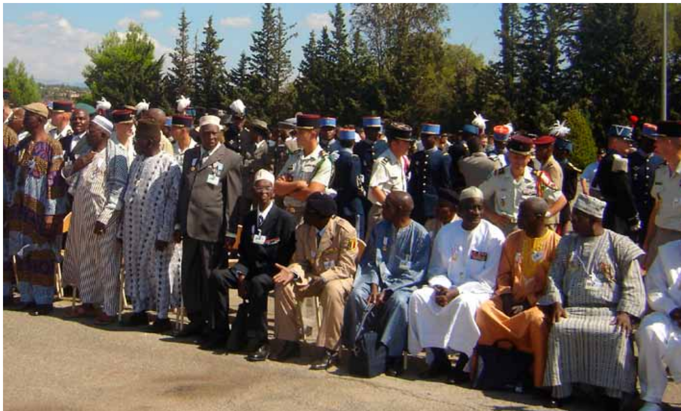
Fréjus, en 2007, à l'occasion du 150 e anniversaire de la création du corps des tirailleurs sénégalais, à l'honneur au premier rang, les « Anciens », invités pour l'occasion et, derrière eux, en casoar, képis bleu-ciel et bérêts, leurs « jeunes », actuellement élèves dans les écoles françaises de formation initiale ou de perfectionnement.