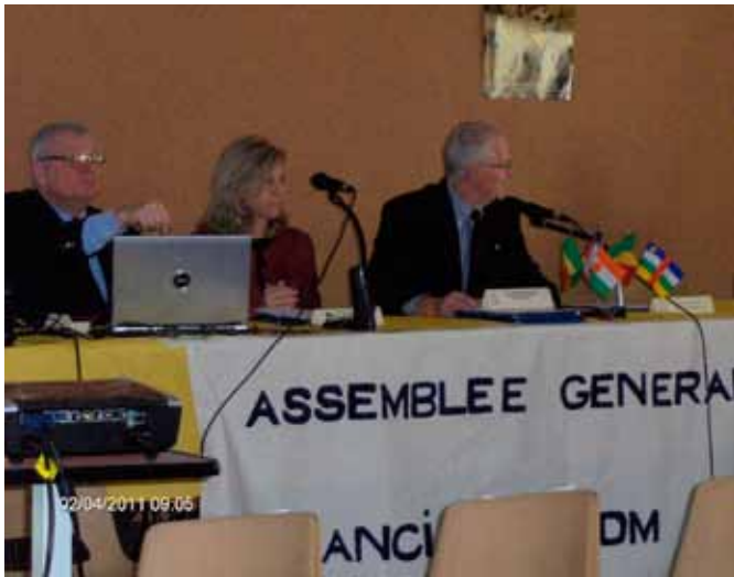
AG 2011 à Privas (Ardèche)