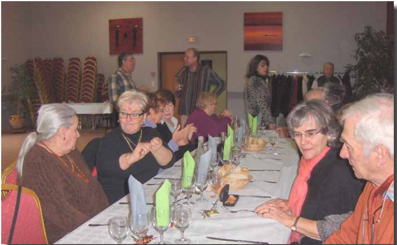
Le 11 janvier 2011, repas de cohésion à Guilherand-Granges

Nos adhérents malades ou isolés bénéficient de visites, d'aides ponctuelles et d'assistance de la part des membres de l'association.