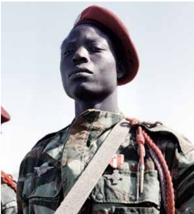
AFN, 1957, ce volontaire africain, servant dans un régiment d'appelés parachutistes des troupes coloniales, cité au combat, vient d'être décoré... Nos régiments parachutistes, RPC puis RPIMa comprendront dans leurs effectifs, jusqu'à 30 % d'Africains, amalgamés aux appelés métropolitains.