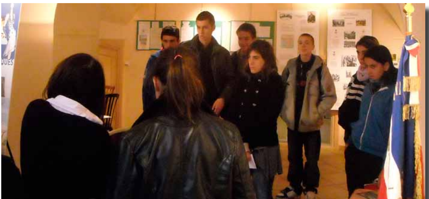
Le 20 octobre 2010, à Tournon...