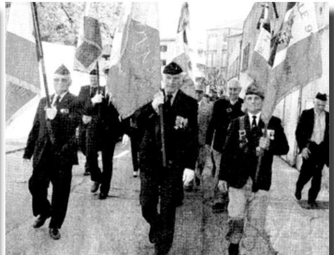
AG 2011 à Privas, défilé après la cérémonie...