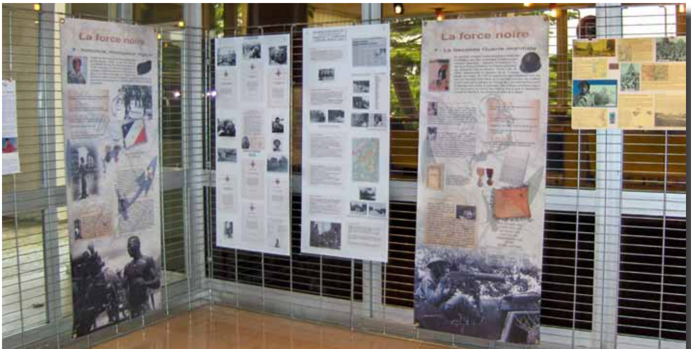
Le 19 avril 2008, exposition à l'hôtel de ville de Pierrelatte