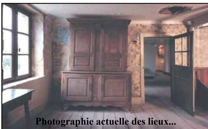
Photographie actuelle des lieux...