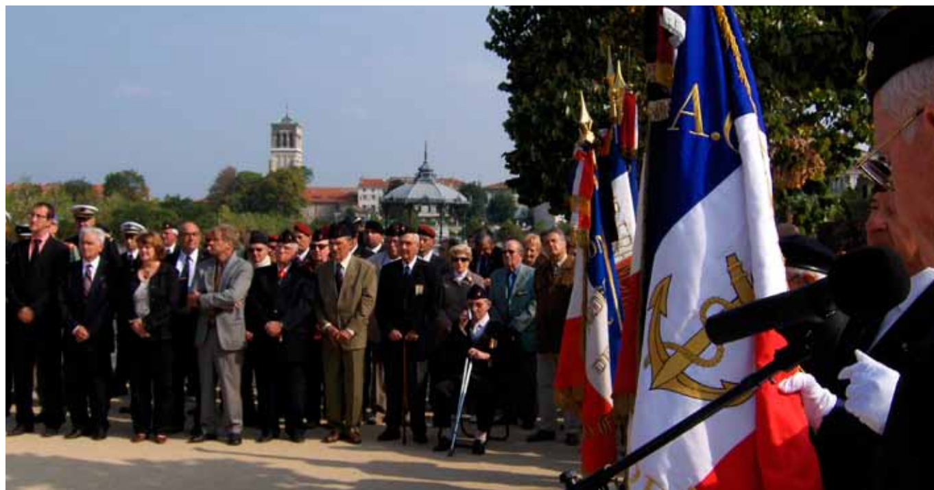
Bazeilles, le 12 septembre 2009, à Valence, comme chaque année devant le monument des Mobiles sur le champ de Mars..