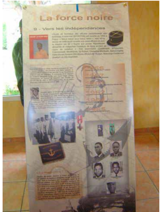
Notre exposition La Force Noire ... un des douze panneaux qui, sous l'égide de l'ONAC-VG, présentent la véritable histoire des tirailleurs.