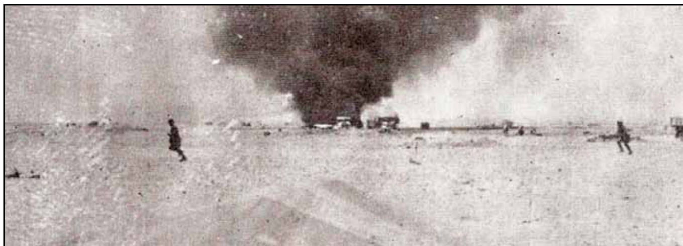
Bir-Hakeim : sous les bombardements...

Bir-Hakeim, première bataille importante, menée au grand jour par une grande unité française contre l' Afrika-Korps du général Erwin Rommel et l'élite de l'armée italienne, marque la renaissance de l'armée française aux yeux du monde. Parmi les unités présentes, plus de la moitié appartiennent aux troupes coloniales (la demi-brigade coloniale et le 1 er régiment d'artillerie coloniale) aux côtés de la 13 e DBLE.