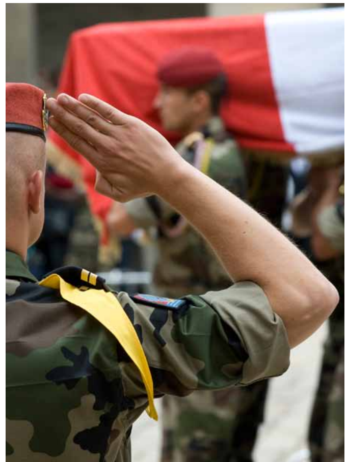
Tués en Afghanistan, nous leur rendons un dernier hommage...