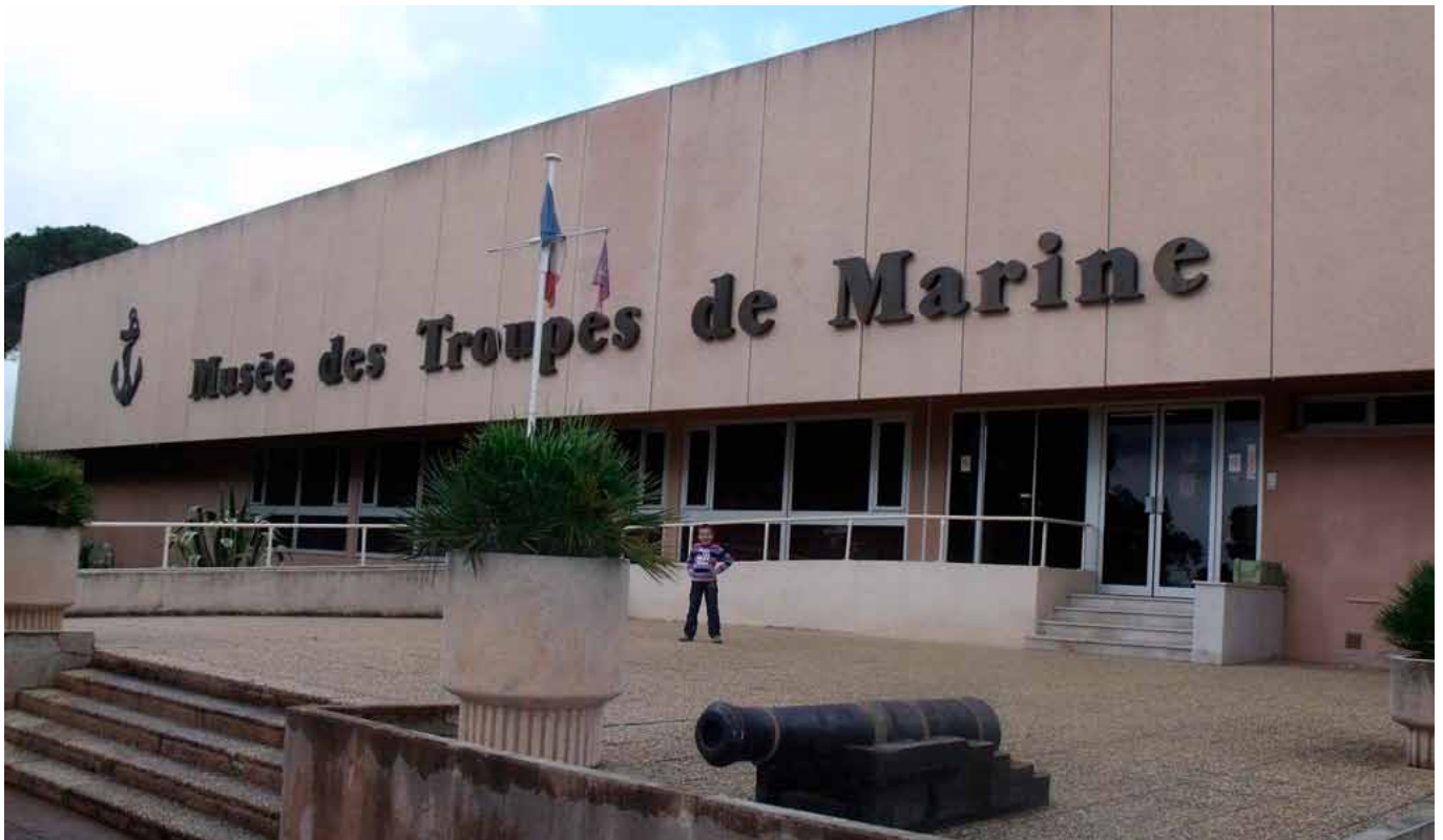
Fréjus : façade du musée des Troupes de marine...

La fédération veut préserver l'existence de ce musée national de Fréjus.