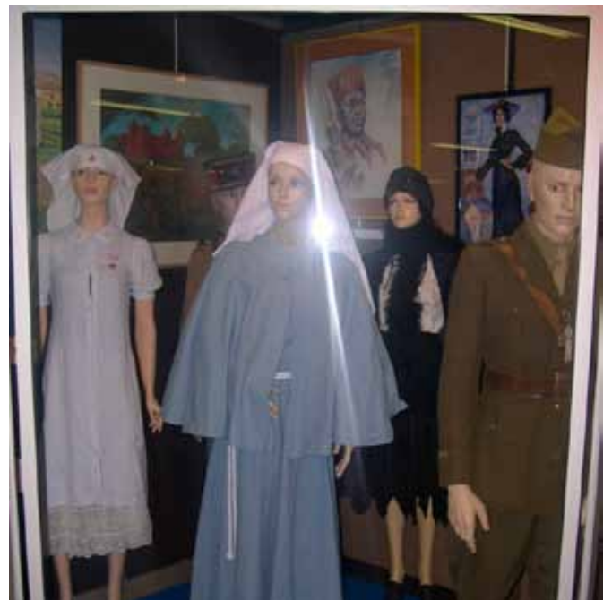
Autres uniformes des années 30, qui avec l'armement, les équipements, les tableaux et les objets usuels de l'époque, nous transportent loin dans l'espace et le passé.