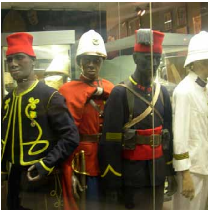
Vitrine d'uniformes de la fin du XIXe siècle, témoins de l'époque de l'expansion coloniale... tirailleurs et spahis sénégalais, officier d'infanterie de la Marine...

La fédération est mobilisée pour aider à trouver une solution acceptable, permettant de préserver l'essentiel.